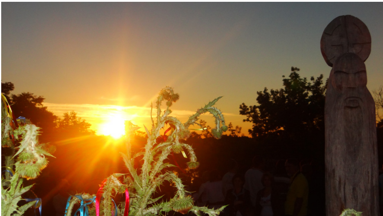
Та метафізична суть Сонця гарантувати Ритми Життя для планети Земля.